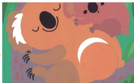
Не беда, если малыш приклеил наклейку неровно. Со временем он научится совмещать края наклейки и белой области.