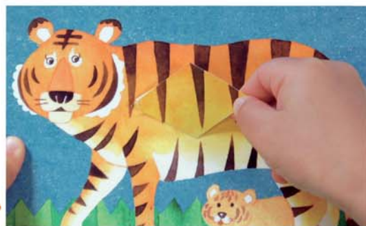
Ребёнок держит наклейку за краешек и пытается приклеить её на специально обозначенное место.

● Возможно, ваш малыш уже играл с наклейками, но приклеивал их куда придётся. Сначала ему будет трудно приклеивать наклейки на специально обозначенные места. Однако спустя время он научится делать это безошибочно.