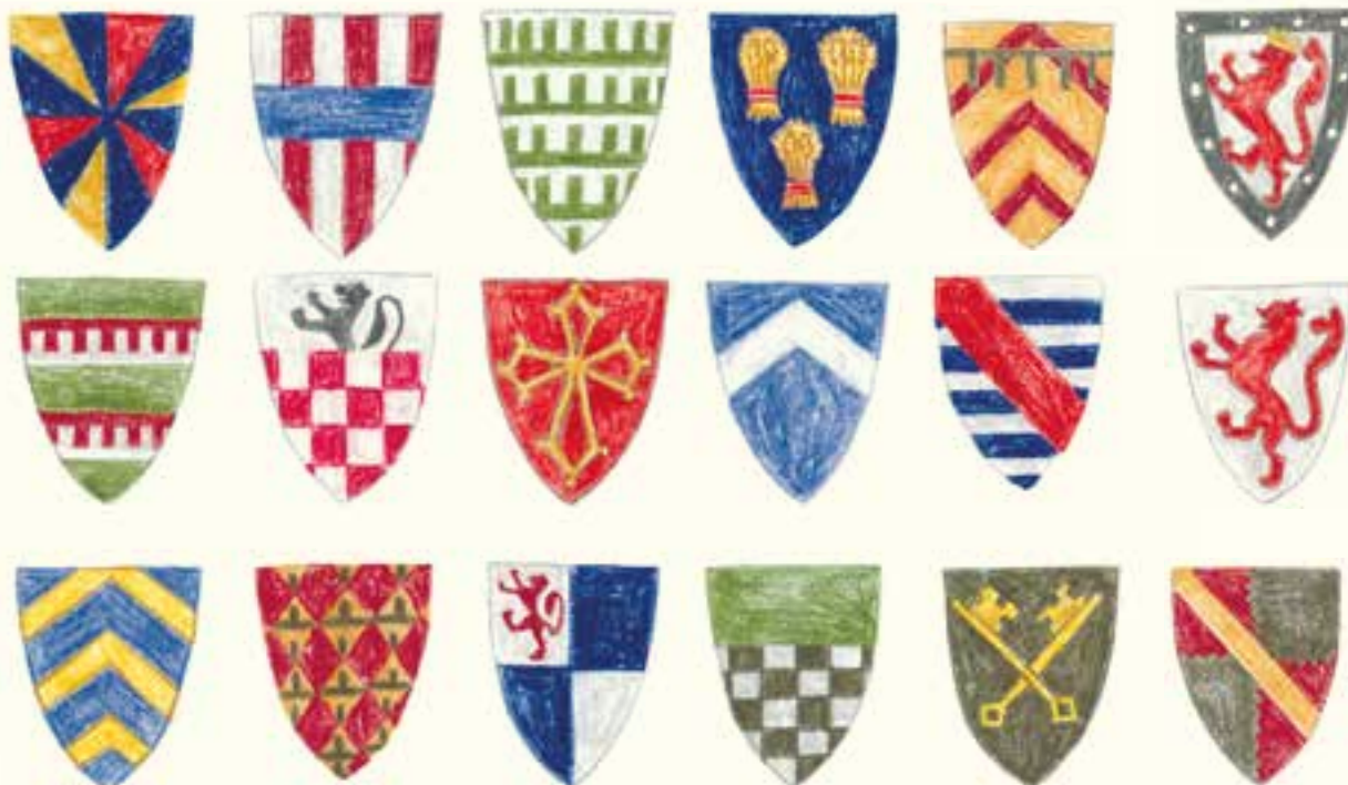
Гербы знатных семейств