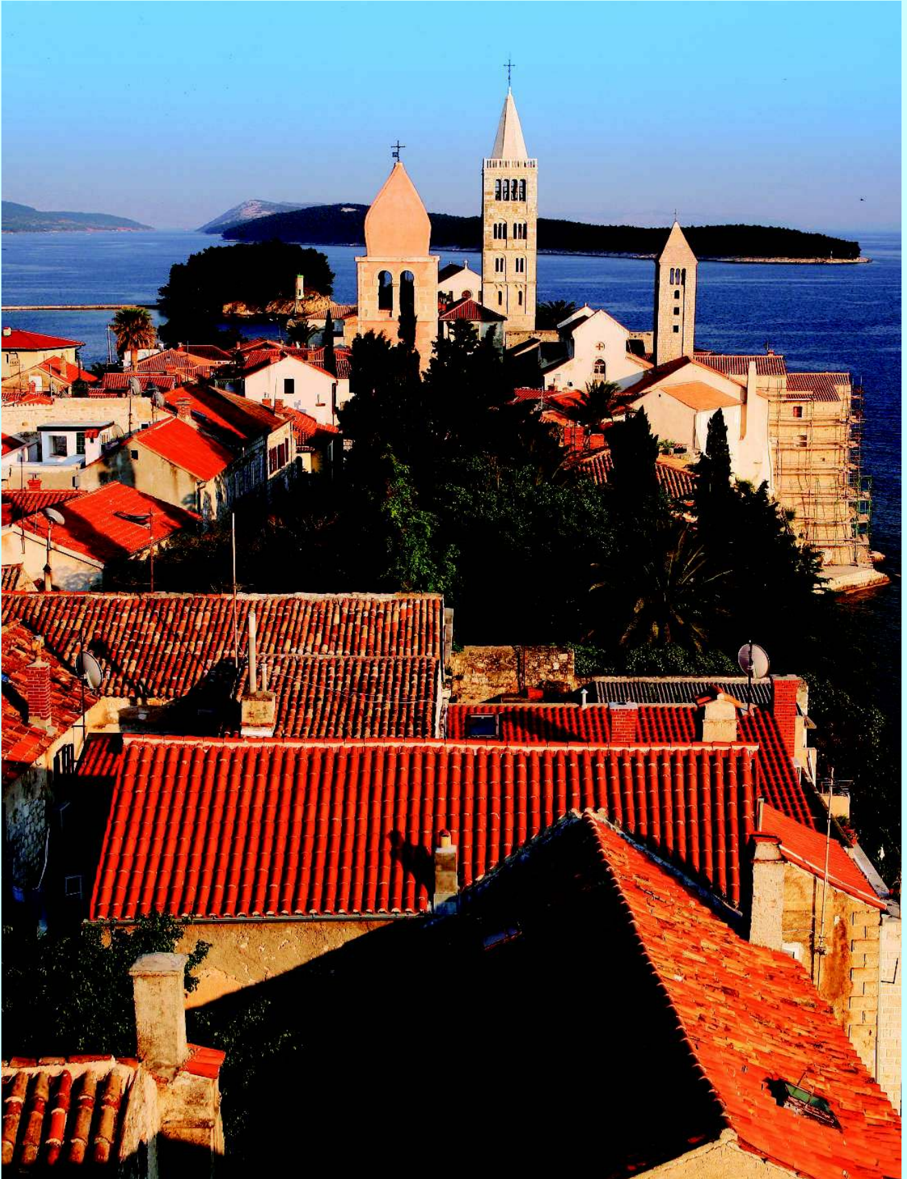
Море за колокольной средневекового Раба в Хорватии