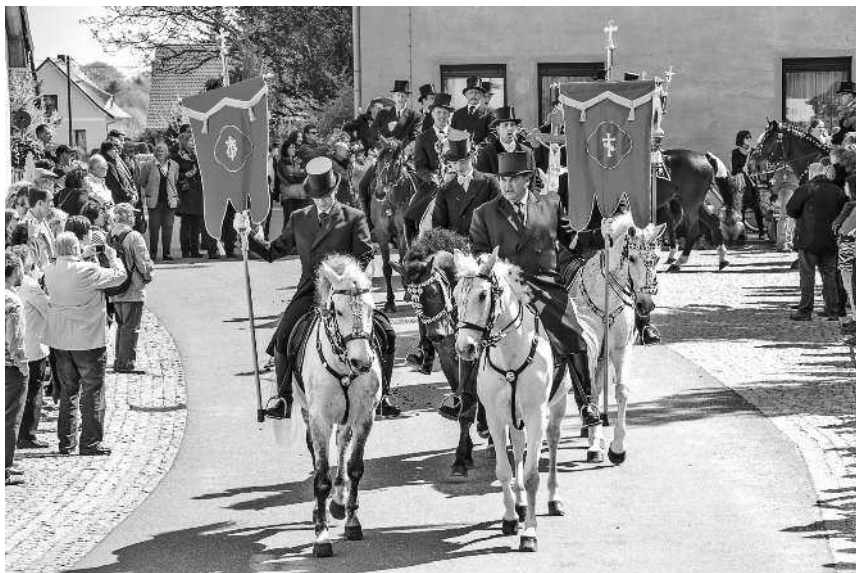
Лужицкие сербы празднуют Пасху, Радибор возле Баутцене, Германия — 20 апреля 2014