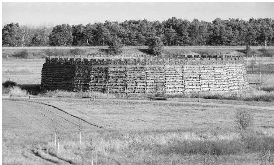
Славянская крепость Раддуш

Так, современные немцы, сами того не замечая, соблюдают традиции, которые сюда когда-то принесли венеды.